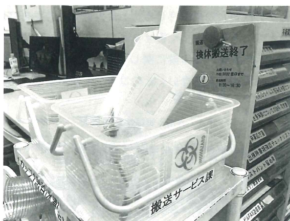
写真 2 現状の人手搬送の際に使用されるカゴ