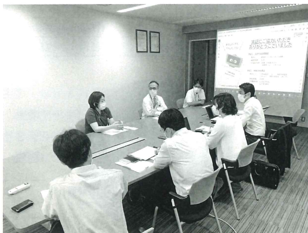
写真3 座談会の様子(2023/7/13)

※代替効果は、現状の人手搬送時間5分(表3より)に、上記平均搬送回数16回/日×365日で削減時間を計算、平均時給を¥2,200として削減人件費を算出した。