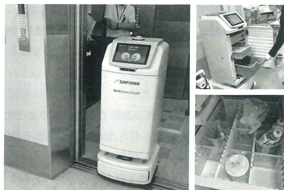
写真 1 AMR(左)/積載部(右上)/搬送例(右下)